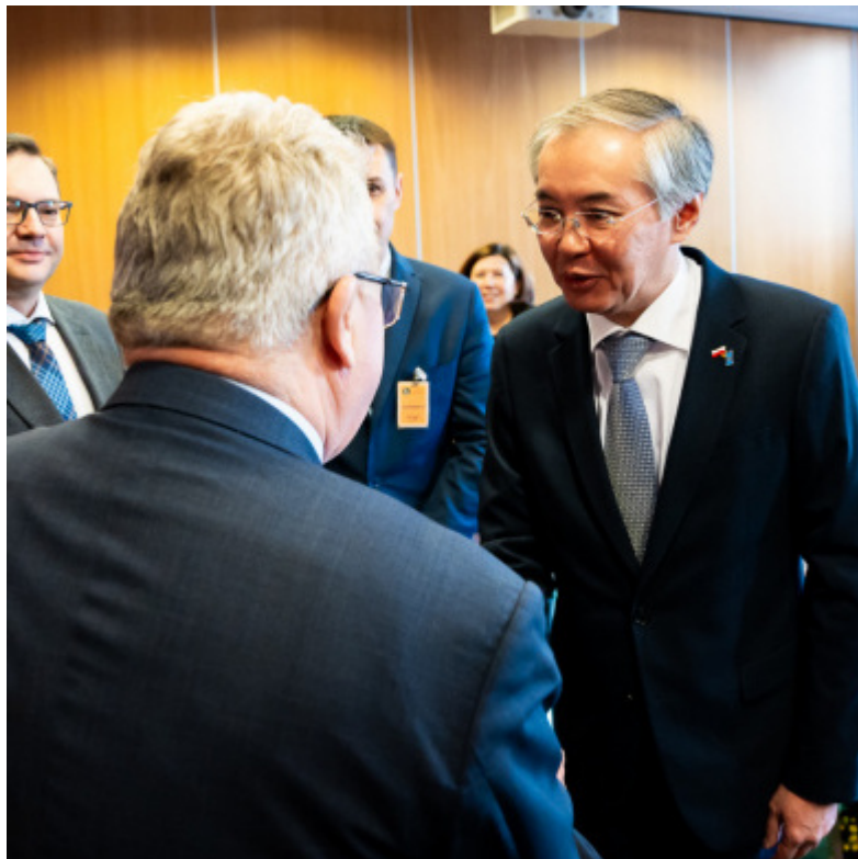
Minister Czesław Siekierski wita ambasadora Kazachstanu Alima Kirabaewa