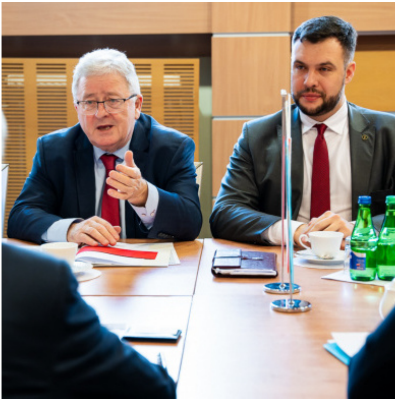
Od lewej minister Czesław Siekierski i wiceminister Adam Nowak