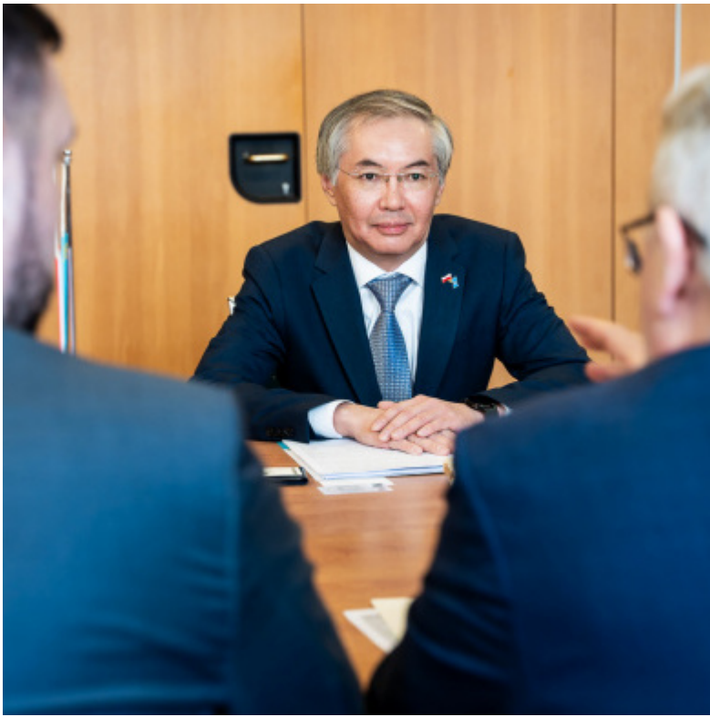
Ambasador Kazachstanu w Polsce Alim