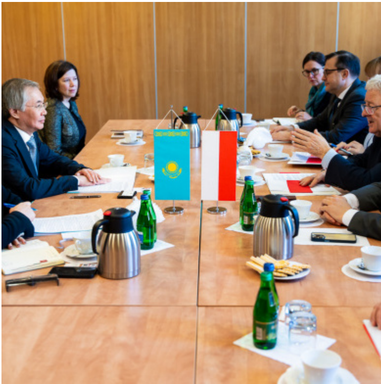
Rozmowy polsko-kazachstańskie w MRiRW