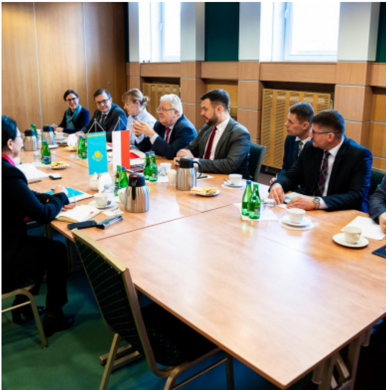
Strona polska podczas rozmów z ambasadorem Kazachstanu Alimem Kirabaewem