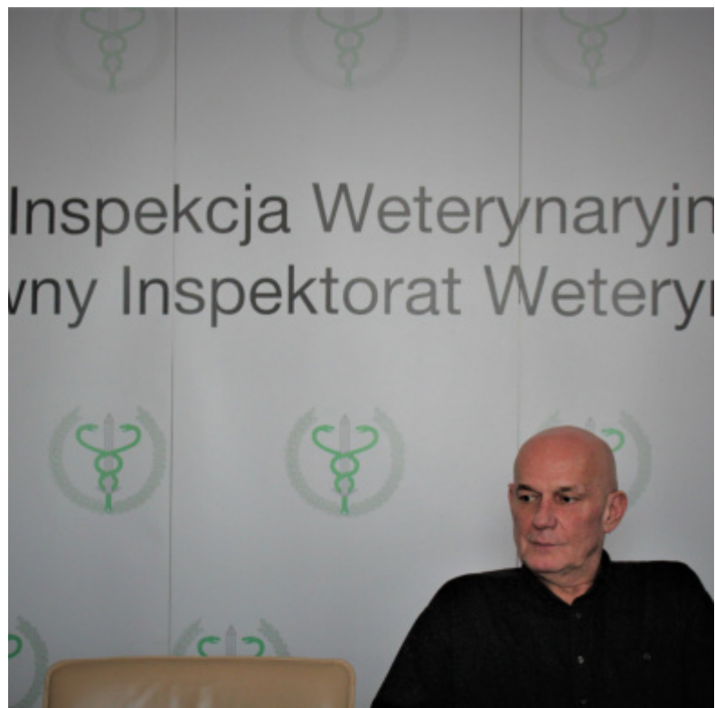
IW-SYSTEM - prace trwają