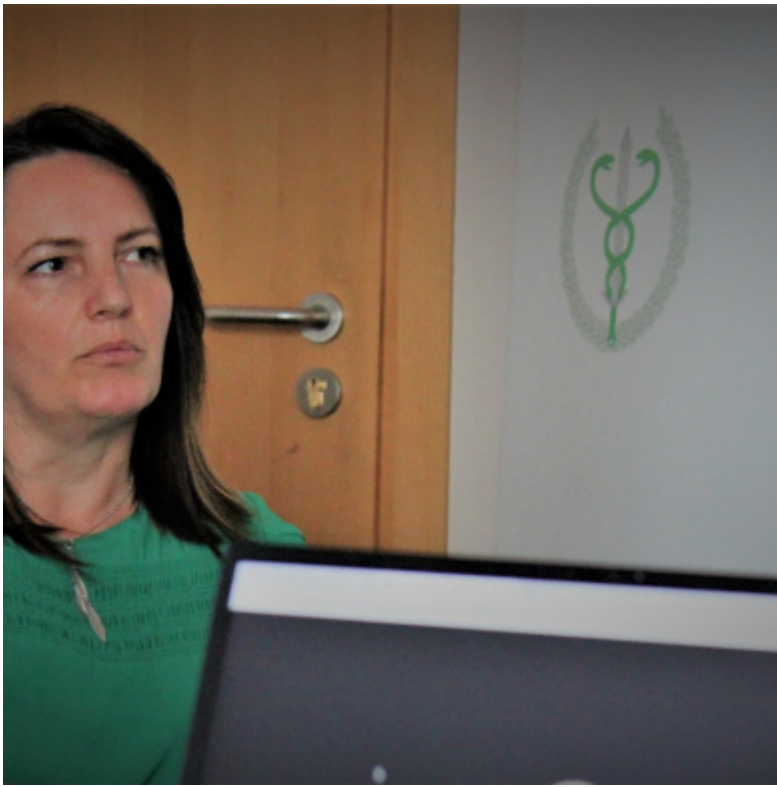
IW-SYSTEM - prace trwaja