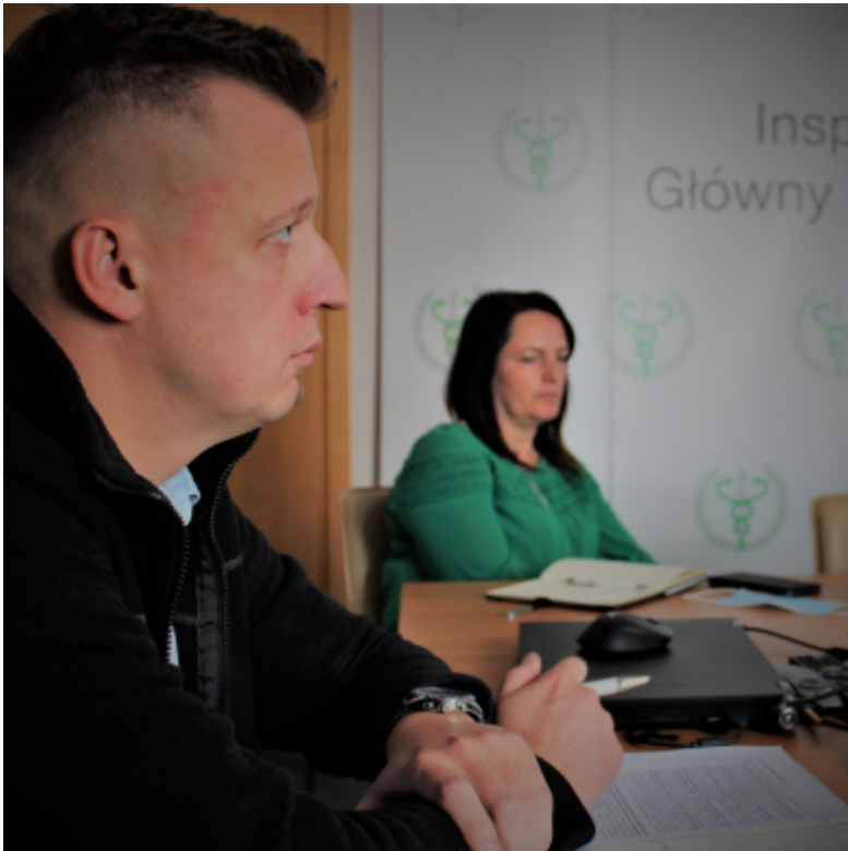
IW-SYSTEM - prace trwaja