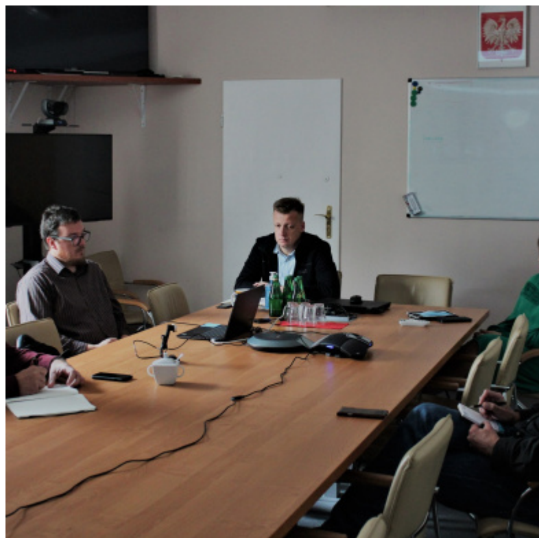
IW-SYSTEM - prace trwają