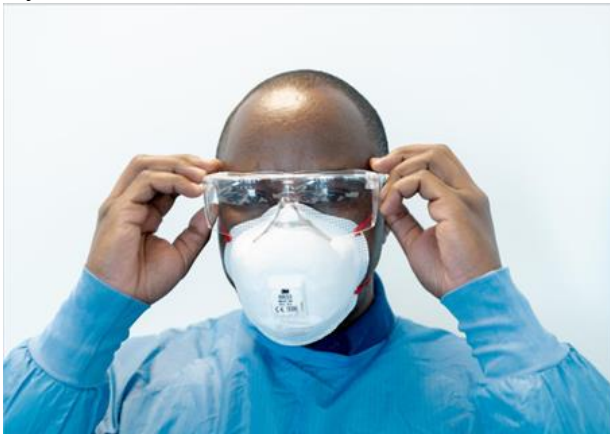
Ryc. 11. Noszenie okularów z zausznikami

Po okularach następne są rękawiczki. Podczas noszenia rękawic ważne jest, aby naciągnąć rękawicę, aby zakryła nadgarstek na mankietach fartucha (ryc. 12). Dla osób uczulonych na rękawice lateksowe powinna być dostępna opcja alternatywna, na przykład rękawiczki nitrylowe.