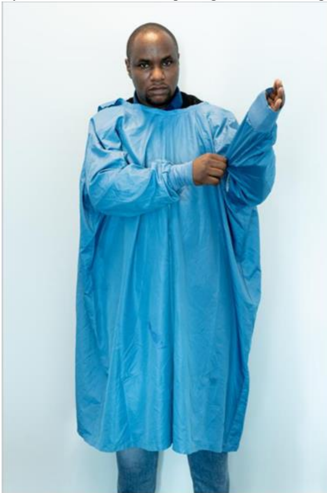
Ryc.3. Zakładanie wodoodpornego fartucha z długim rękawem

Pierwszy element ochrony indywidualnej, jaki należy założyć (ryc. 3) to fartuch. Istnieją różne rodzaje fartuchów (jednorazowego użytku, wielokrotnego użytku); niniejsze wytyczne przedstawiają wodoodporny fartuch z długimi rękawami wielokrotnego użytku. Podczas korzystania z fartucha z zapięciem z tyłu, jak pokazano poniżej, druga osoba powinna pomóc zapiąć guziki z tyłu (ryc. 4).