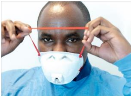
Ryc. 5. Noszenie maski FFP (klasa 2 lub 3)

Metalowy klips na nos musi zostać wyregulowany (ryc. 6), a paski muszą być napięte, aby zapewnić mocne i wygodne dopasowanie.