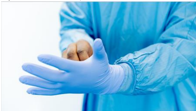
Ryc.12. Noszenie rękawic