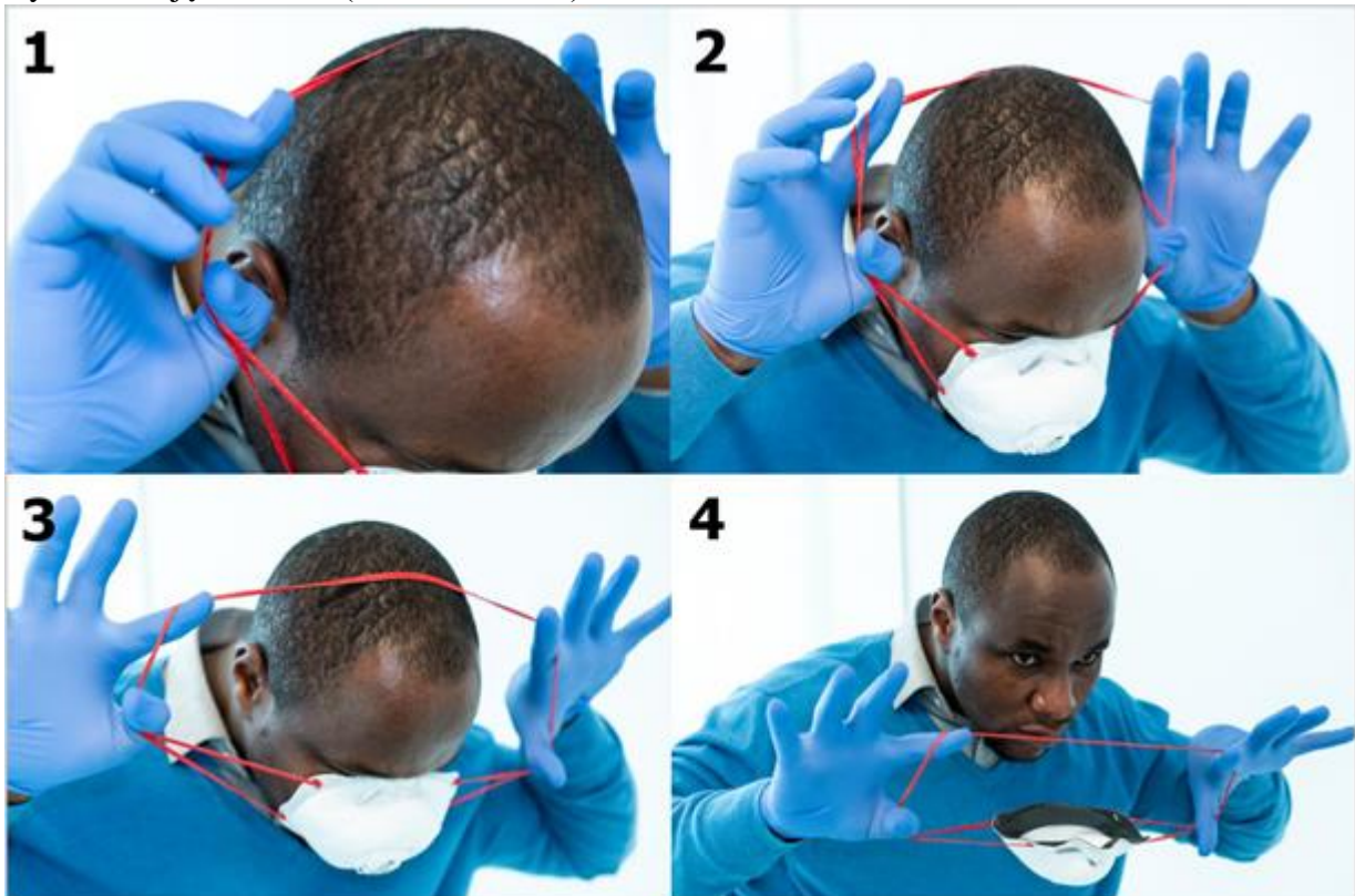
Ryc. 20. Zdjęcie maski (kroki od 1 do 4)

Ostatnimi rzeczami, które należy zdjąć są rękawice. Przed zdjęciem rękawic należy rozważyć użycie roztworu na bazie alkoholu. Rękawice należy zdjąć zgodnie z procedurą opisaną powyżej. Po zdjęciu rękawic należy wykonać higienę rąk.