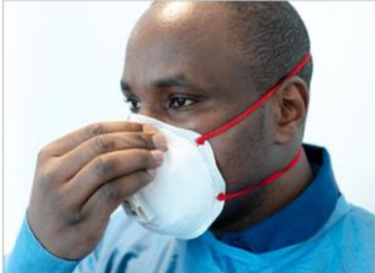
Ryc.6. Dopasowanie metalowego klipsa na nosie

Metalowy klips na nos musi zostać wyregulowany (ryc. 6), a paski muszą być napięte, aby zapewnić mocne i wygodne dopasowanie.