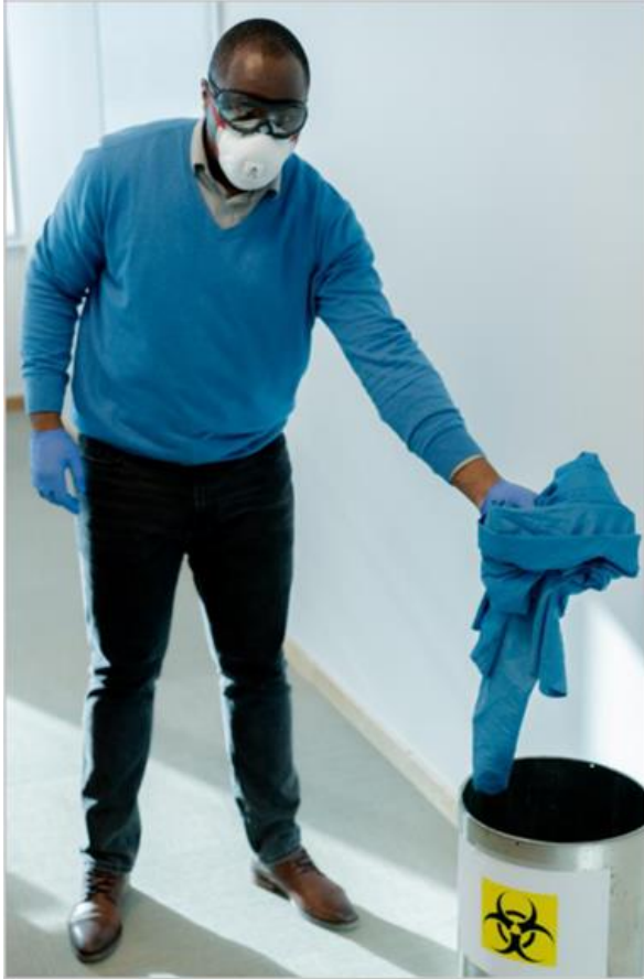
Ryc. 17. Usunąć fartuch do kosza na odpady zakaźne

Po fartuchu należy zdjąć i wyrzucić okulary, jeśli są jednorazowego użytku, lub umieścić w torbie lub pojemniku do dezynfekcji. Aby zdjąć okulary, należy umieścić palec pod elastycznym pasem z tyłu głowy i zdjąć je, jak pokazano na rycinie 18. Należy unikać dotykania przedniej części okularów, która może być zanieczyszczona. Jeśli używane są okulary z plastikowymi zausznikami, należy je zdjąć, jak pokazano na rycinie 19.