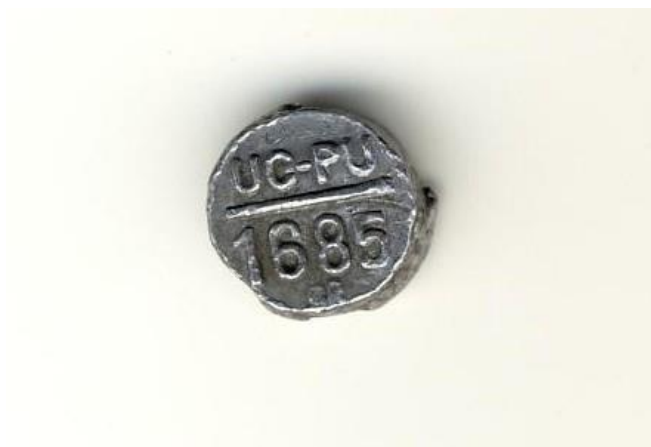
Przykładowy odcisk odwrotnej strony plomby.