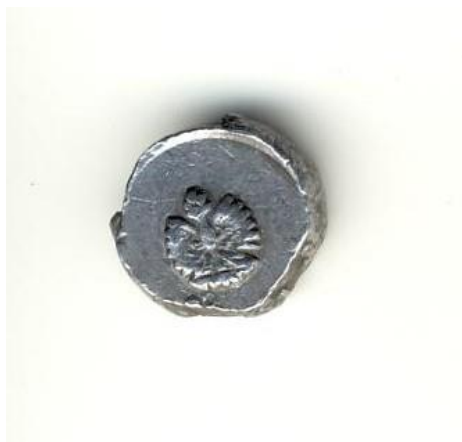
Przykładowy odcisk przedniej strony plomby.

plomby odciska się plombownicą godło państwowe, a na odwrocie litery "UC-PU" i czterocyfrowy albo trzycyfrowy, poprzedzony dużą literą alfabetu, identyfikator plombownicy.